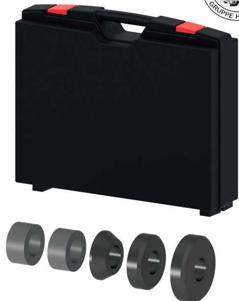
Der Zentriersatz für Speichenfelgen (1 Koffer, 2 Distanzstücke, 1 Konus, 2 Zentrierhülsen).